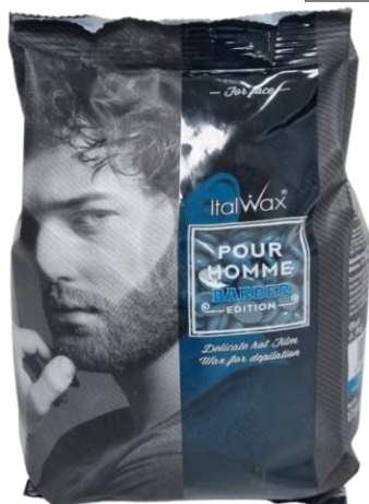
Dyll Barber edition 500gr..

Dylli metalik i zi me ngjyrë blu me densitet mesatar projektuar posaçërisht për stilimin e mjekrës dhe Procedurat e depilimit të fytyrës së plotë të mashkullit. Bazuar në polimeret më të mira sintetike, heq të fortë dhe qimet e ashpra të fytyrës së njeriut.