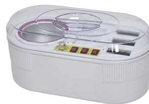
Ngrohes I kombinuar 80.00€