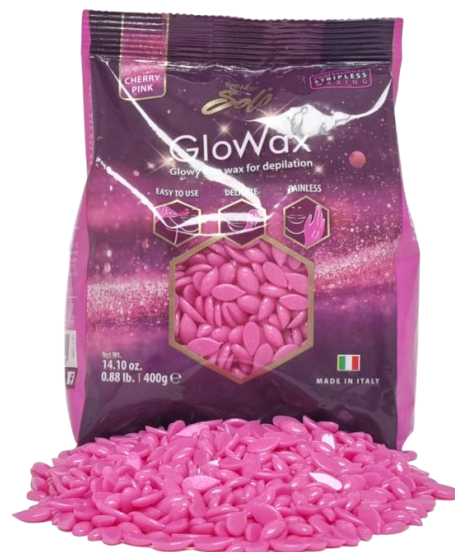
Dyll Cherry Pink 400gr – 9.00€