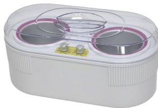
Ngrohes 2x800ml 80.00€