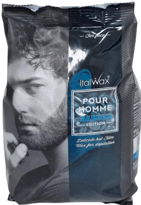
Dyll Barber edition 500gr..