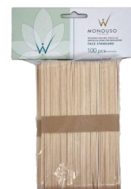
Shkopinj standart 140x16x1,6_100cop 2.50€