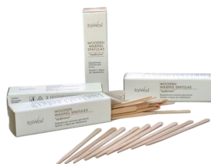
Shkopi per Vetulla 50 cop - 4.00€