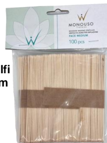
Shkopinj Selfi 114x10x2mm 100cop 1.60€