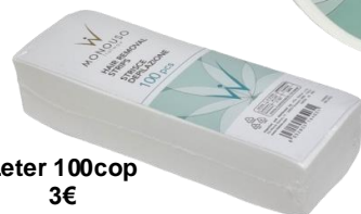
Leter 100cop 3€