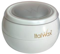
Aparat Glowax 100ml 25.00€