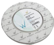
Rrath mrojtese 20cop 2.70€