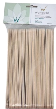
Shkopinj Full Body 200X24X1.6mm 60cop 6.00€