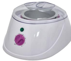
Ngrohes 450ml 49.00€