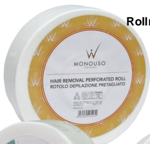
Rollne me ndamje 80m 10.50€