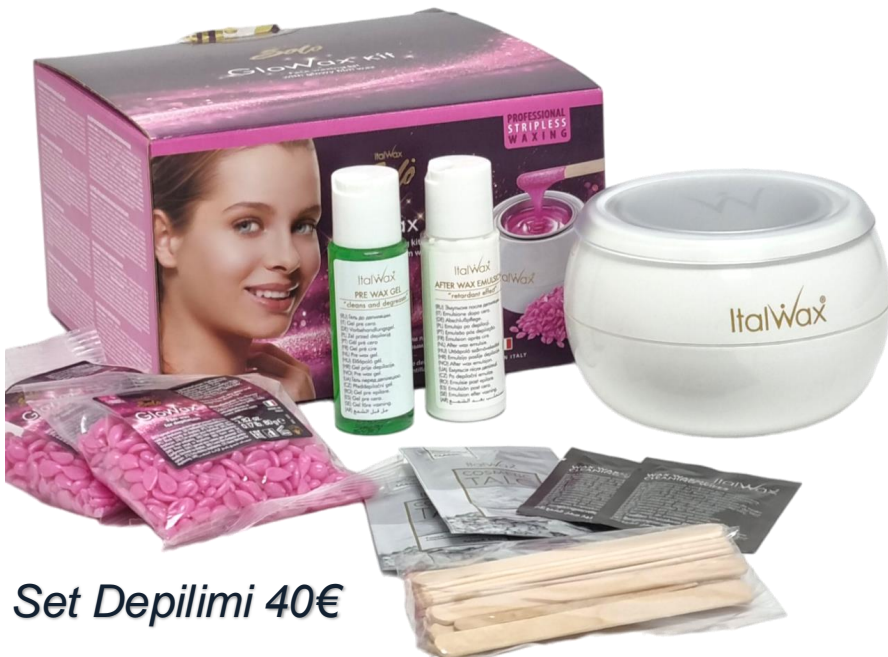
Set Depilimi 40€

Kompleti i depilimit të fytyrës me dyll filmi shkëlqyes dhe produkte të reja për depilimin në shtëpi Italwax Solo