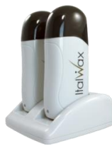
Ngrohes-2 100ml 32.00€