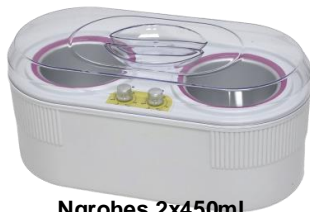
Ngrohes 2x450ml 80.00€