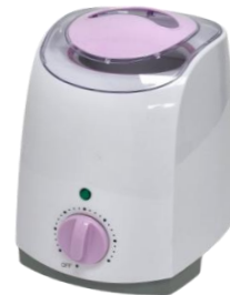
Ngrohes 800ml 59.00€