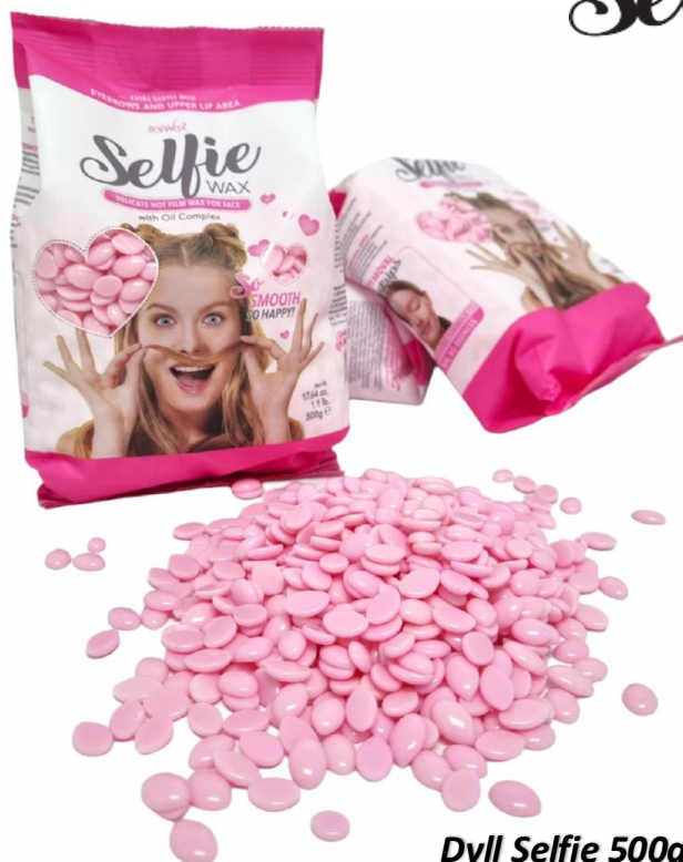
Dyll Selfie 500gr - 9.00€

E përkryer për procedurat e heqjes së qimeve të vetullave dhe buzës së sipërme.