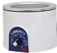
Ngrohes 400ml 55.00€