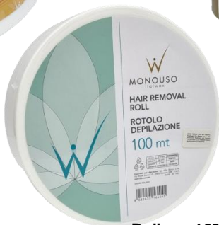
Rollne - 100m 10.50€