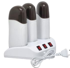
Ngrohes-3 100ml 43.00€