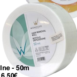
Rollne - 50m 6.50€