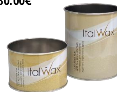
Kanaqe e that 400ml 1.30€ 800ml 1.60€