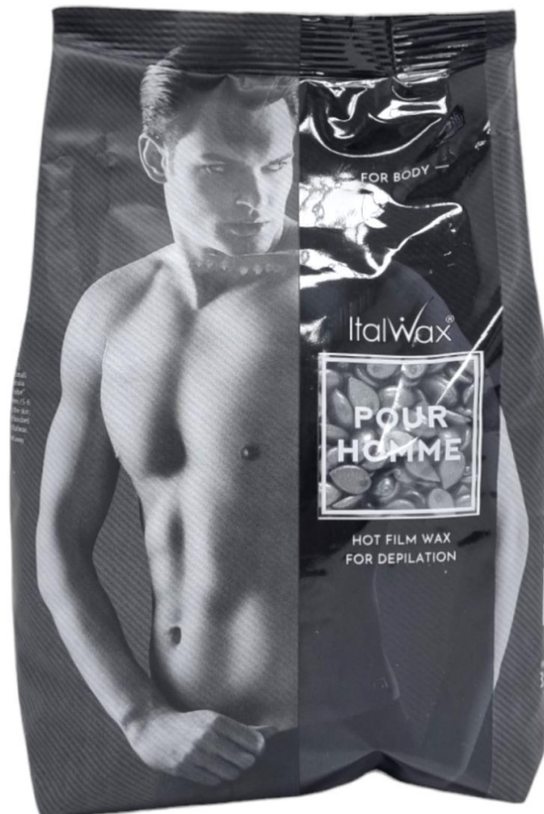
Dyll POUR HOMME 1kg